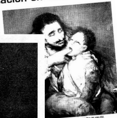
original propuesta basada en el famoso libro del siglo XVI el texto con sus acciones in- serras españolas. Y de ahí, a las tablas. "Hemos encontrado un momen-