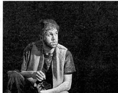
Un momento de la representación en Almagro.